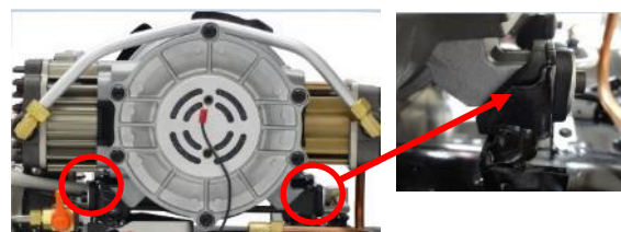
ゴム形状のダンパが振動を抑えます。